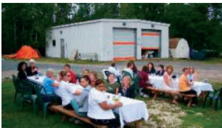
Barbecue du Red Lake Medical Centre.