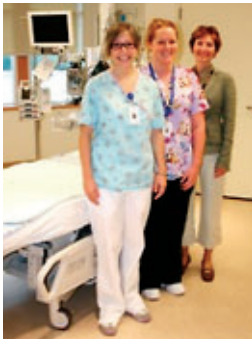
Unité de soins intensifs de l'Hôpital régional de Thunder Bay.